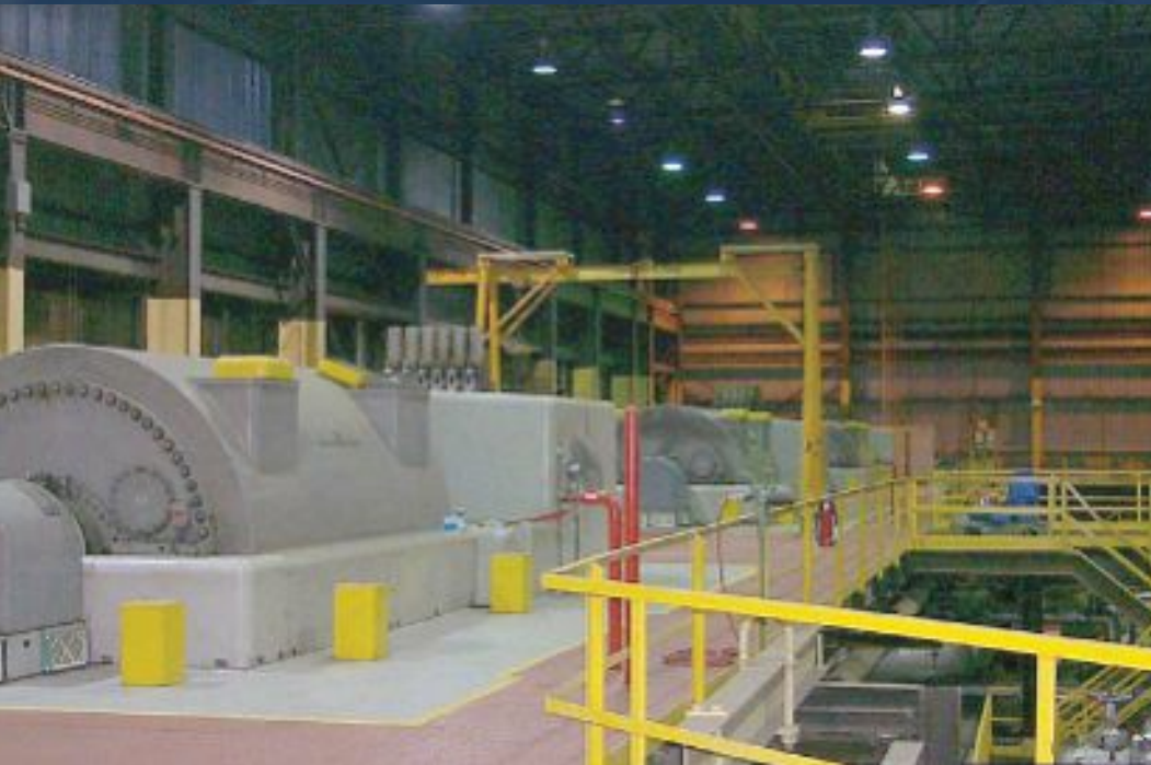
Генераторы 2 уровня с пробоотборным воздухопроводом VESDA в защищенной области и детекторным модулем, расположенным в аппаратной комнате для удобства доступа и техобслуживания.

Кроме того, что система VESDA служит альтернативной заменой линейно-лучевым детекторам, она в одиночку способна заменить много одноточечных детекторов дыма. Национальная ассоциация пожарной безопасности США (Статья NFPA72 нормативов) констатирует: "Каждая пробоотборная точка воздухопробоотборного детектора дыма, с точки зрения ее размещения и расположения, трактуется как детектор точечного типа." [NFPA 72, Раздел 5.7.3.3.1]